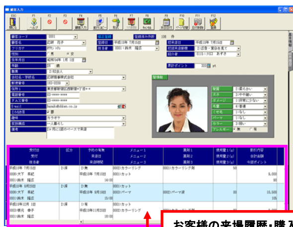
お客様の来場履歴・購入履歴も簡単に画面表示できます